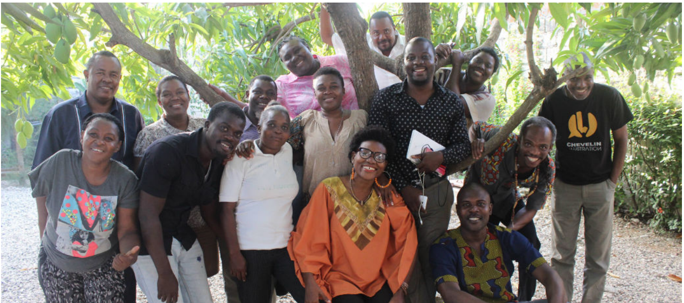
Manm ekip kreyasyon Yon Kominote Ini San Vyolans

Kòm nou dokimante tout metodoloji ak lòt zouti nou te sèvi e yo disponib, moun kapab fasilman refè entèvansyon menm jan ak sa ki te fèt nan La Vallée de Jacmel e, fè sa sou pi gwo echèl depi resous ak angajman disponib pou sa.