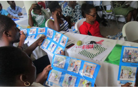
Aktivis Kominotè k ap aprann mennen brase lide ak yon afich

nivo vyolans fizik ak vyolans seksyèl sou fanm ki nan koup te bese pou rive mwatye sa li te ye pandan peryòd pwogram nan (soti 23% pou rive 12%).