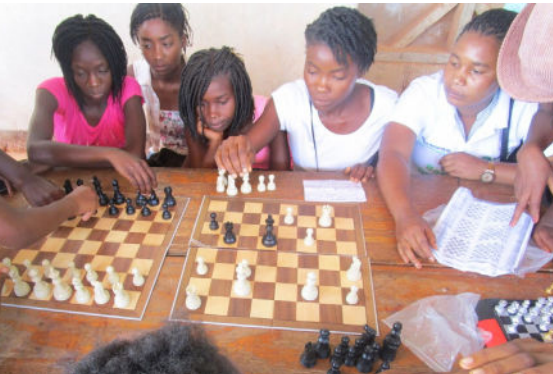
Manm klèb tifi k ap jwe echèk

An jeneral, rechèch la montre SASA!, Kore Tifi ak Yon Kominote Ini San Vyolans genyen yon enpak pozitif sou lavi fanm ak tifi nan La Vallée. Se pa bò kote moun ki te patisipe dirèkteman nan fòmasyon oubyen lòt aktivite yo obsève chanjman men, se pami tout manm kominote a. Pami chanjman pozitif yo genyen chanjman nan fason moun wè: fanm, gason ak relasyon nan koup (kwayans), ansanm ak prevalans vyolans sou fanm ak tifi.